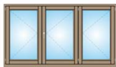
F. 3 ANTE