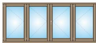
F. 4 ANTE

Clicca nei link sottostanti per visualizzare e scaricare: